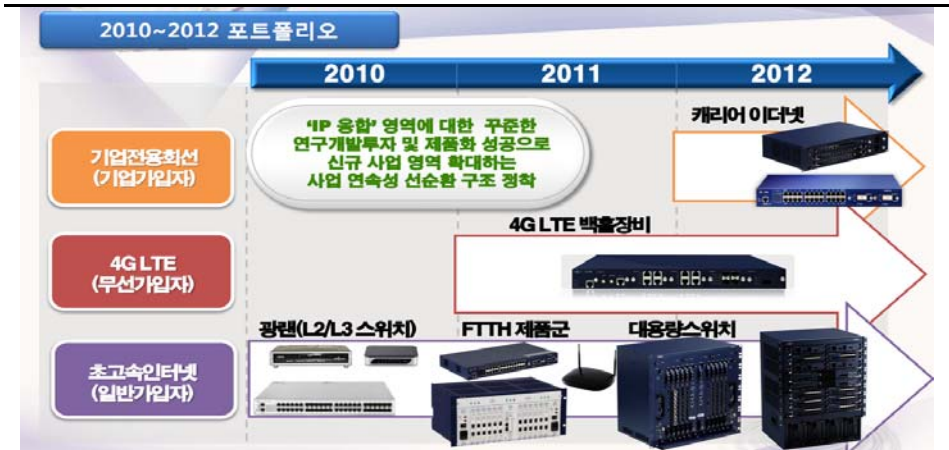
〈그림2〉 유비쿼스 제품 포트폴리오